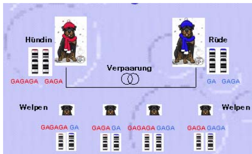
Abb.1: Mikrosatelliten-Vererbung bei einer Hundefamilie

Was jetzt passiert, lässt sich als ausgeklügelte biochemische Reaktion umschreiben. Bei diesem „Mikrosatelliten-Detektions-Verfahren“ werden kleine, individuell unterschiedliche Abschnitte, eben die „Mikrosatelliten (STRs, Marker)“ ( Siehe Abb.:1 ) von der DNA abgelesen und vervielfältigt.